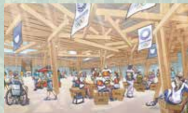
選手村ビレッジプラザ