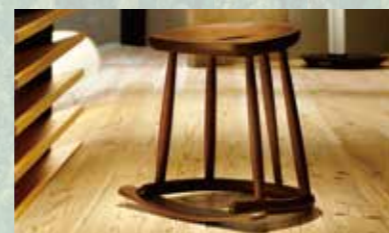
(株)イトーキと連携し開発したスツール