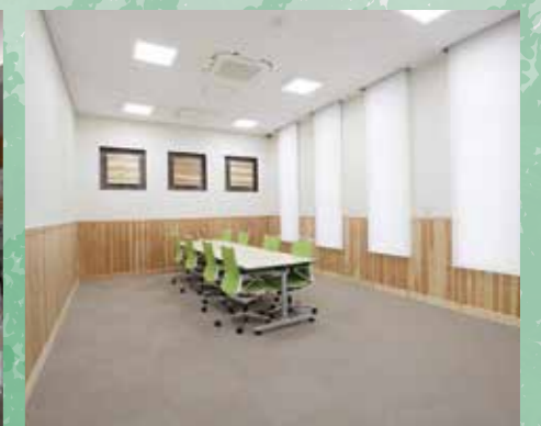
【遠州信用金庫中島支店】