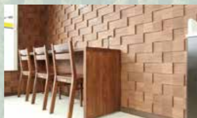
ミニストップ 浜松増楽店