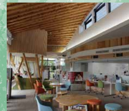
【浜松いわた信用金庫於呂支店】

豊かな認証林から生産される認証材と様々な業態の認証団体の連携により、FSC 認証製品の開発やFSCプロジェクト認証(※)を活用した建築物などの事例が数多く生まれています。これは浜松市が進めるFSC森林認証の理念への共感が根付いている証であり、今後の更なる展開が期待されます。