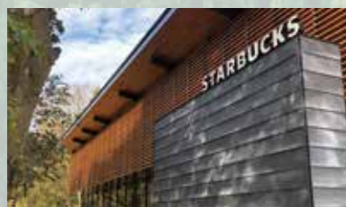
スターバックス コーヒー 浜松城公園店

浜松市内のカフェやコンビニエンスストアのイートインスペースの内装、大手家具メーカーと連携し開発したスツールなど、安定した品質、供給力によって、いろいろな場所で天竜材が利用されています。