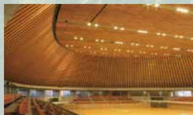
このはなアリーナ

静岡県草薙総合運動場「このはなアリーナ」や富士山静岡空港など、大型の公共施設でも天竜材は利用されています。これは、天竜の山がFSC認証材の安定供給地であることの証です。