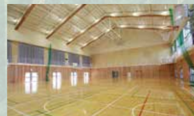
浜松中部学園、体育館