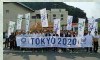
選手村ビレッジプラザへの天竜材納材出発式 (令和元年9月11日)