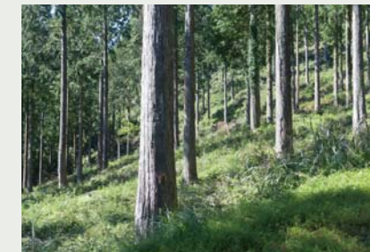
しっかりと手入れされた森林は明るく、下草が生えた美しい森林になります。