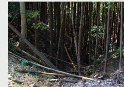
放置されると、陽の入らない暗い森林になってしまいます。

森林には様々な働きがあります。二酸化炭素の吸収や森林で暮らす動植物の多様性、土砂災害の防止や洪水・湯水の緩和などです。人工林は手入れをせずに放置すると荒れてしまい、これらの働きが十分に発揮されません。私たちオクシズ森林認証協議会は、適正な森林管理と持続的な林業経営を通じて、森林の持つ公益的機能と森林環境を保全・増進させていきます。林業は木を伐って売っただけではなく、地域の森づくりを行っているのです。